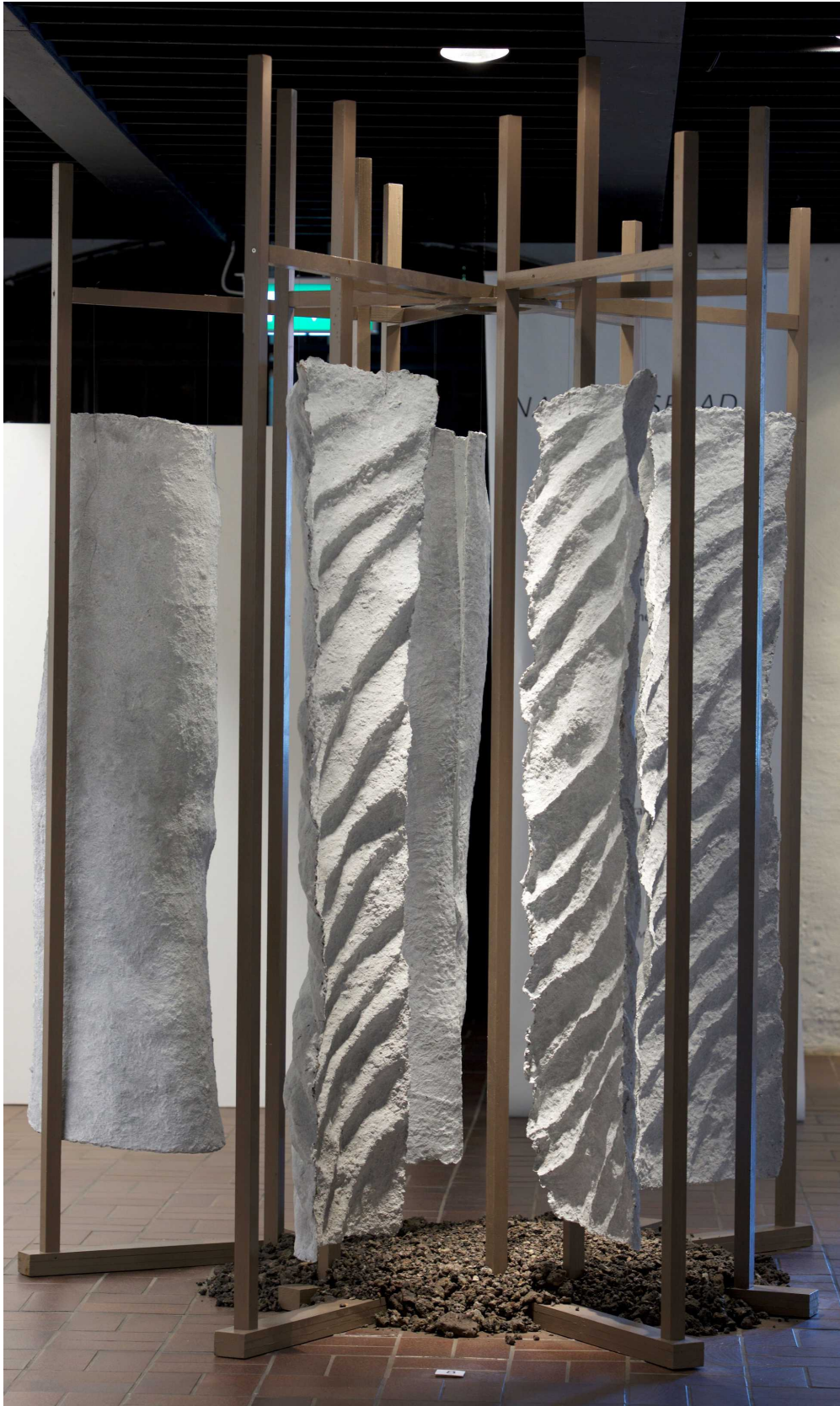
Vibeke Glarbo, "Den russiske erindring".